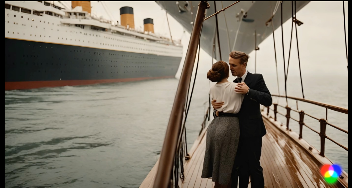
Created by Runway Gen 2

Prompt: "A woman stands on the bow of the Titanic. She stretches out her arms and is hugged from behind by a man"