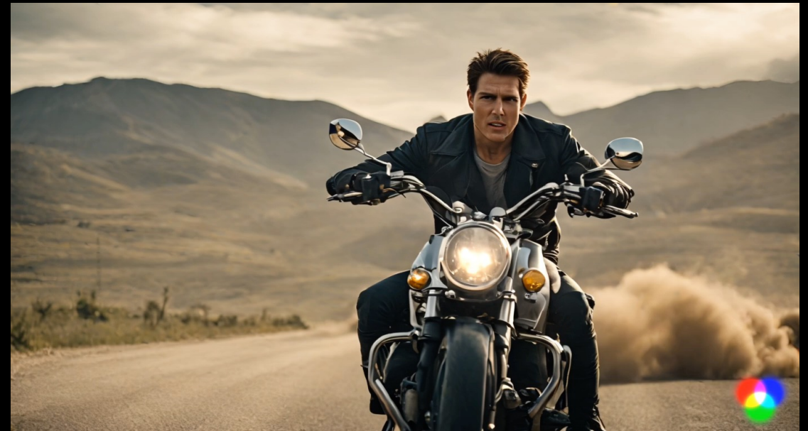
Created by Runway Gen 2

Prompt: "Tom Cruise is riding a motorcycle on a military area"