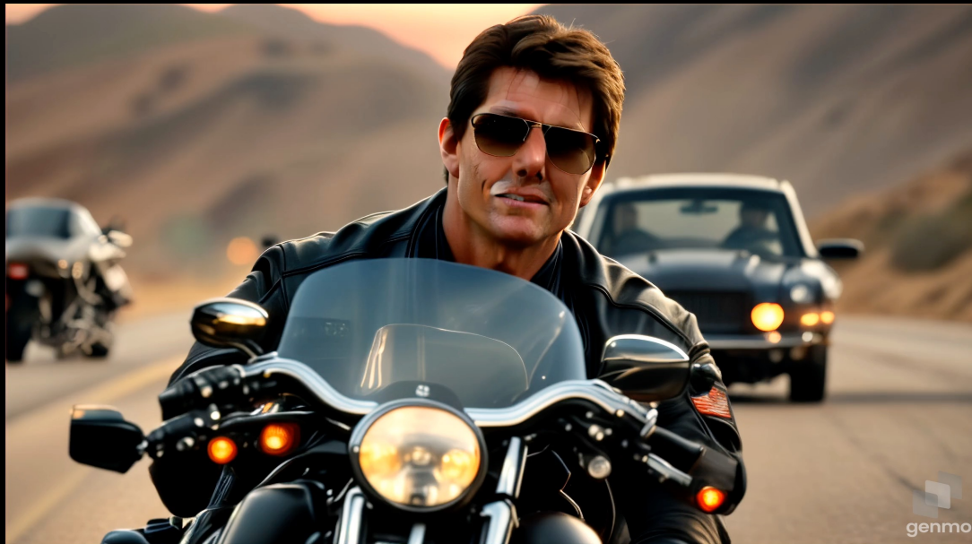
Created by Genmo