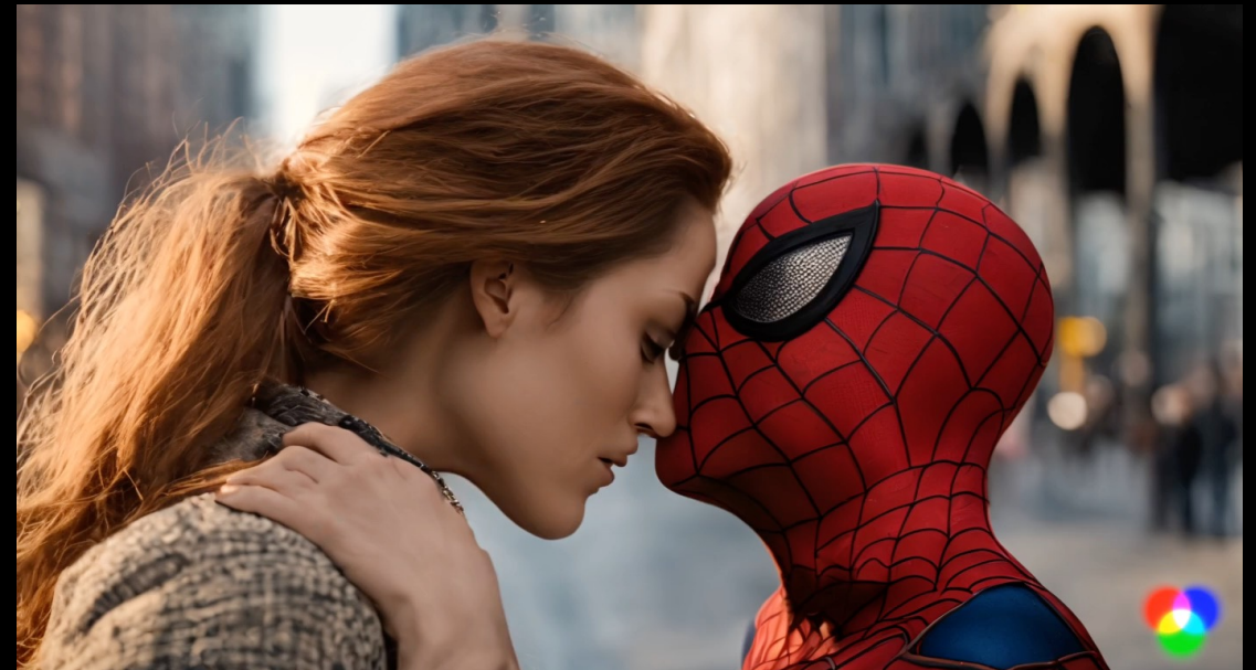
Created by Runway Gen 2

Prompt: "Spider-Man is kissing Mary Jane Watson"