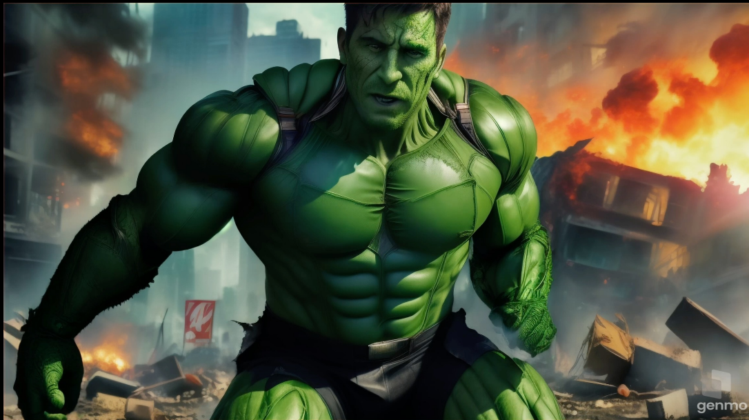
Created by Genmo