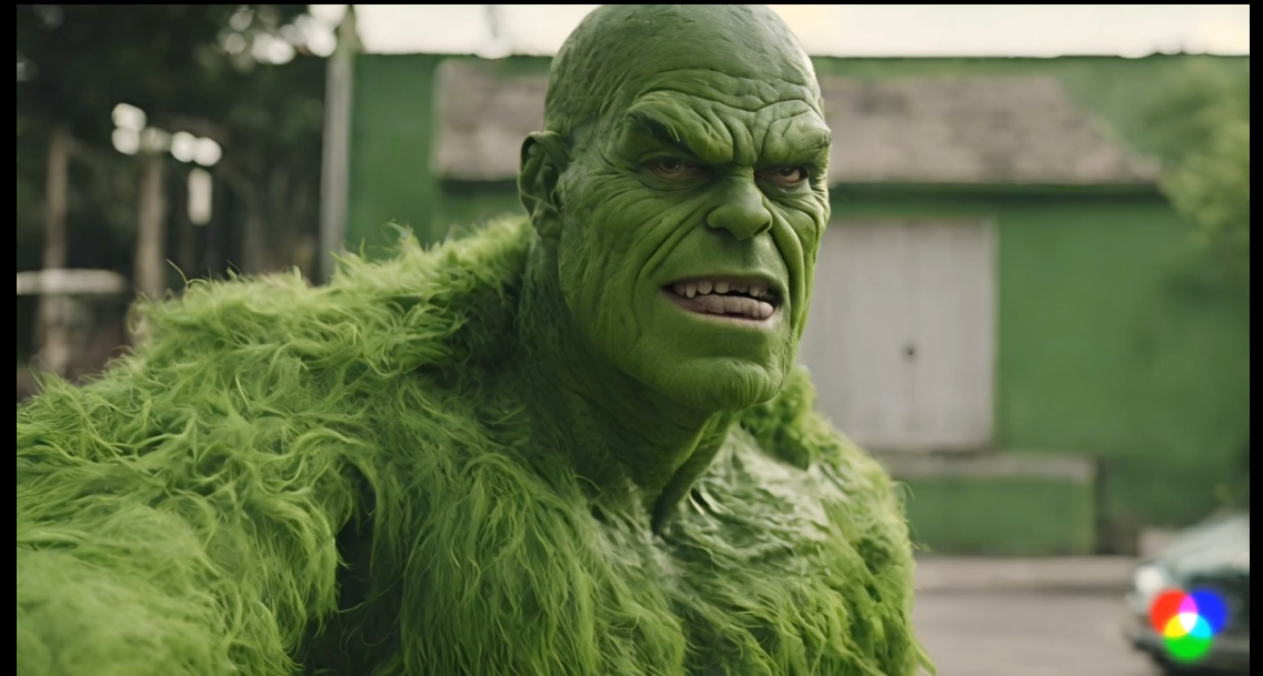
Created by Runway Gen 2

Prompt: "A man turns into a green monster-superhero"