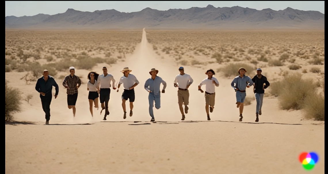
Created by Runway Gen 2

Prompt: "Forrest Gump is running with a group of people in the desert"