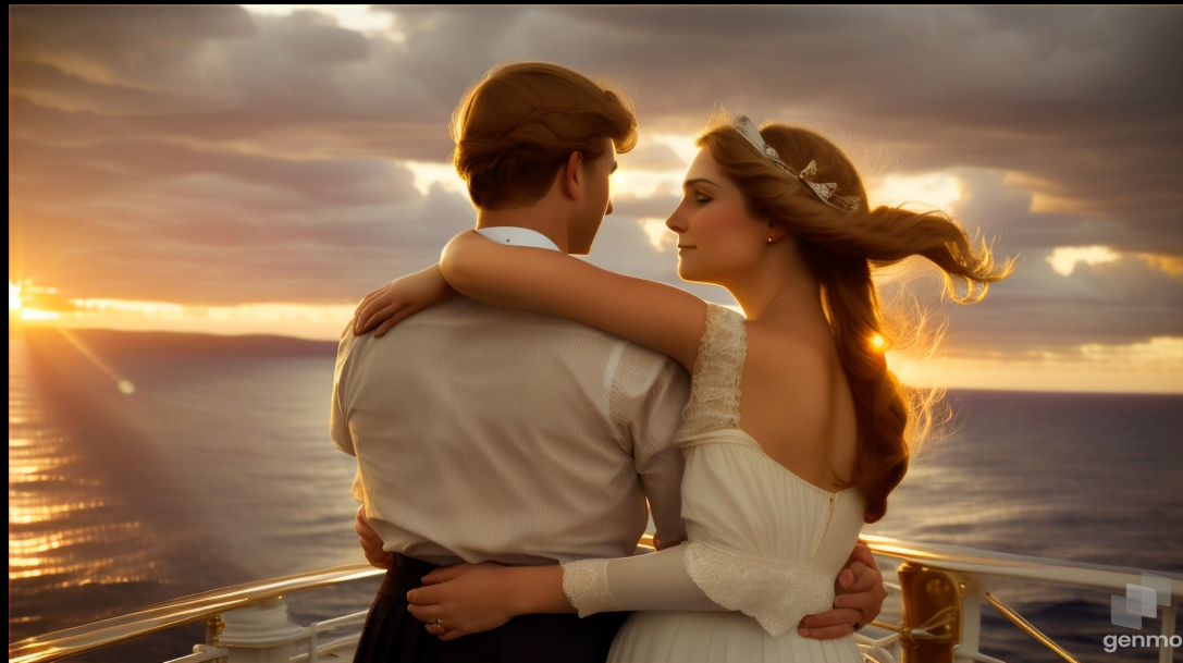
Created by Genmo