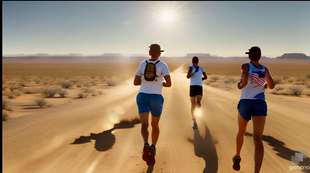
Created by Genmo