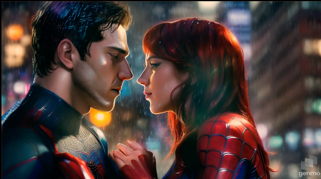
Created by Genmo